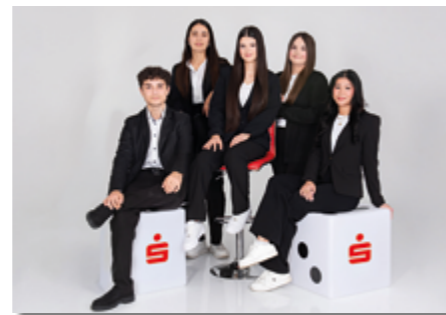
Unser Ausbildungsjahrgang 2025